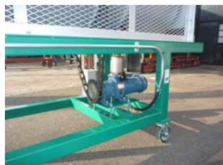
メカニカル式変速モーター